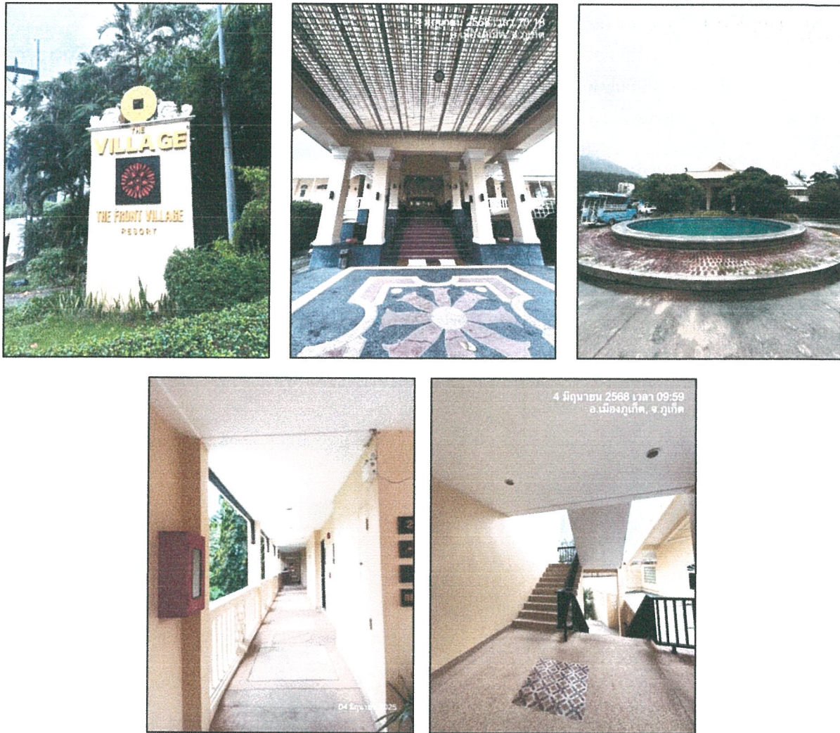
รูปภาพที่ 1.3 การใช้พื้นที่ของโครงการ