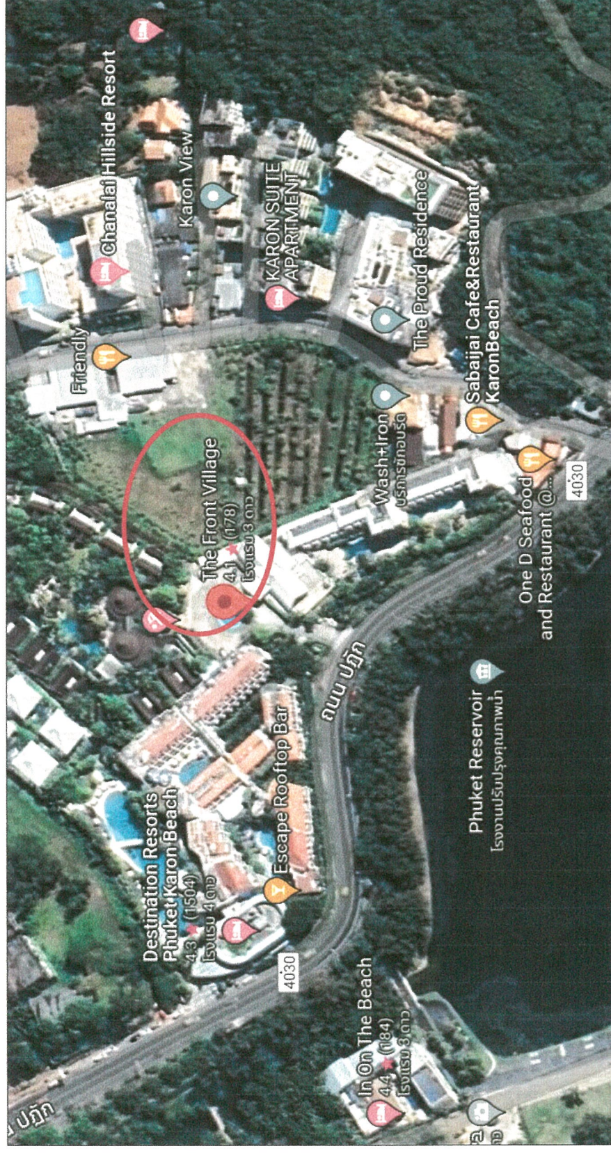
รูปภาพที่ 1.1 แผนที่ตั้งโครงการ The Front Village (Top view)